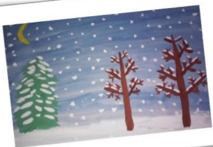
Киселёв Тимур, 2 Б